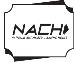
NACH લેઠે મળતા સરકારી લાભો સીધા ખાતામાં