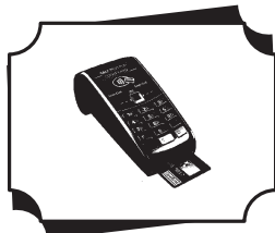
POS - Debit Card ઓફ લાઇન શોપીંગ