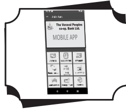
MOBILE BANKING APPLICATION