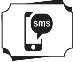
SMS Service દરેક ટ્રાન્ઝેક્શનના એલર્ટ