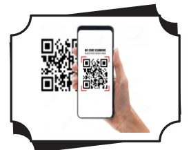
QR Code સરળતાથી નાણાં ટ્રાન્સફર