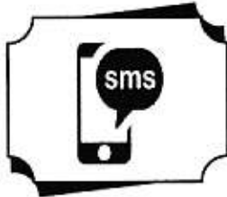
SMS Service દરેક ટ્રાન્ઝેક્શનના ઓલટ