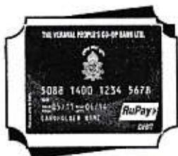
e-commerce Debit Card ઓનલાઇન શોપીંગ