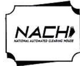
NACH વહે મળતા સરકારી લાભો સીધા ખાતામાં